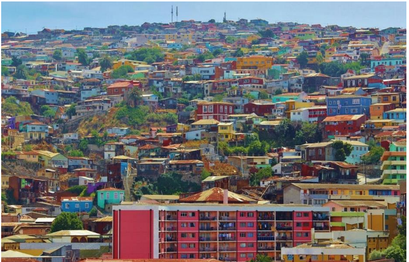
Valparaíso, Chile, by Michelle Ramponi