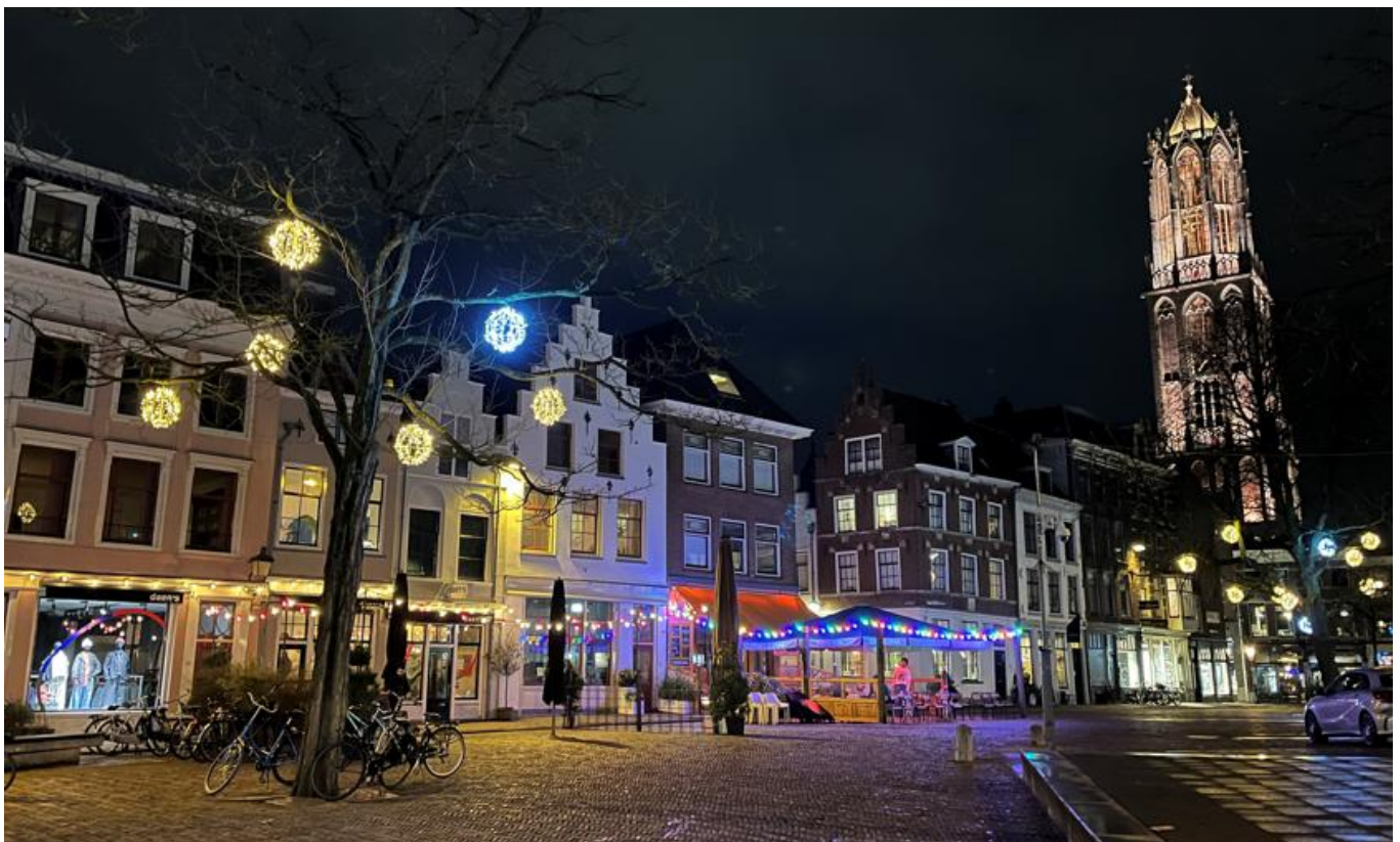
© Anne Guilaine André – Utrecht